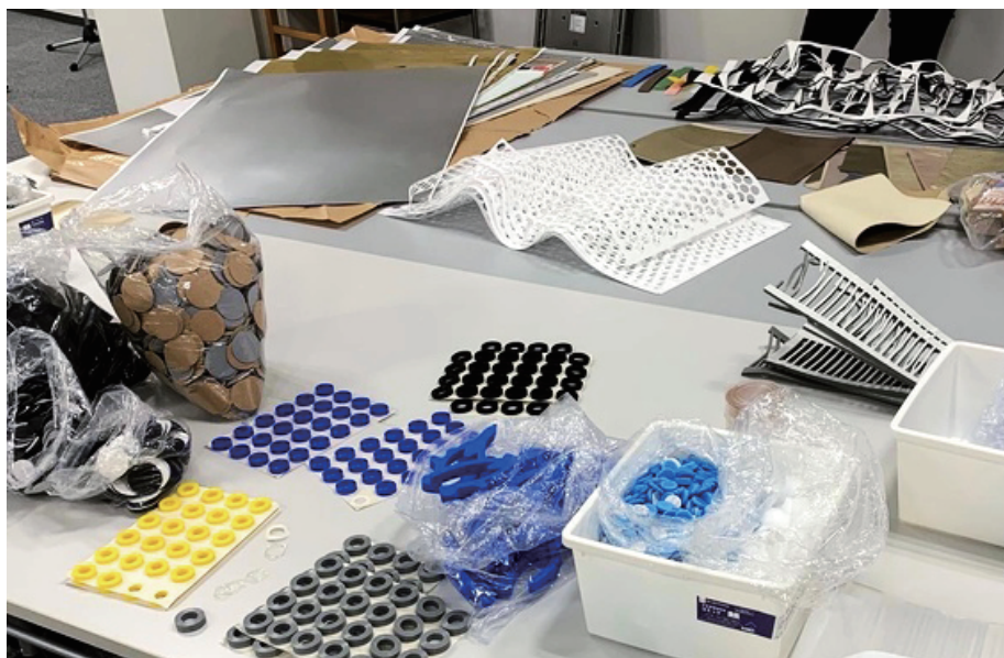
企業から集めたいろいろな端材

テーマはありますが、見本は基本的にありません ( 無から有への体験学習 です) お子様の発想をできるだけ広げられるよう、加工のストレスをいかに減らすかが鍵です。