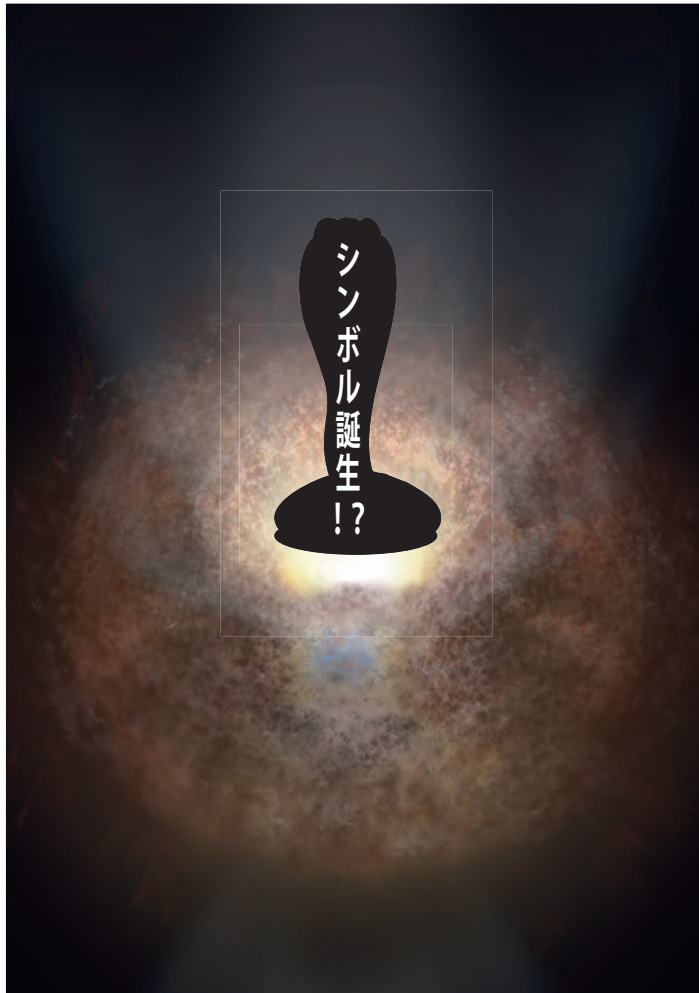
新端材プロダクト誕生 (ギフトショーにて発表)

コロナ禍でワークショップは一時中止し、プロジェクトは開発先行スタイルに切り替えました。ワークショップは端材プロダクト発表後の再開を予定しています。